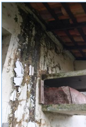
FOTO 09 e 10: INFILTRAÇÕES PROVENIENTE DAS PÉSSIMAS CONDIÇÕES DO TELHADO