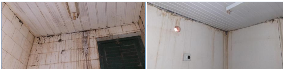
FOTO 07 e 08: GOTEIRAS NO TELHADO OCASINONADO UMIDADE E RISCOS DE CHOQUE